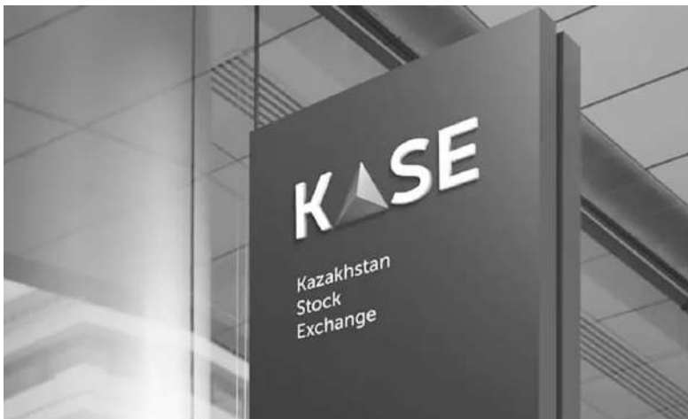
카자흐스탄 주식 거래소

카자흐스탄 증권거래소 (KASE)는 포브스카자흐스탄 통신사의 문의에 대해, MOEX(모스크바증권거래소)가 보유하는 KASE의 주식을 매입하거나 KASE와 합의된 3자에게 매각할 가능성에 대해 MOEX와 협상할 계획이라고 답변했다.