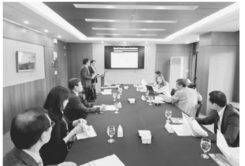
▲ 히든기업경영전략연구소는 3일 오전 한국프레스센터에서 카자흐스탄 카스피안 그룹회장단과 한국의 의료산업계가 카자흐스탄 알라타우시티 프로젝트에 참여할 수 있는 방안에 대해 적극 논의했다.