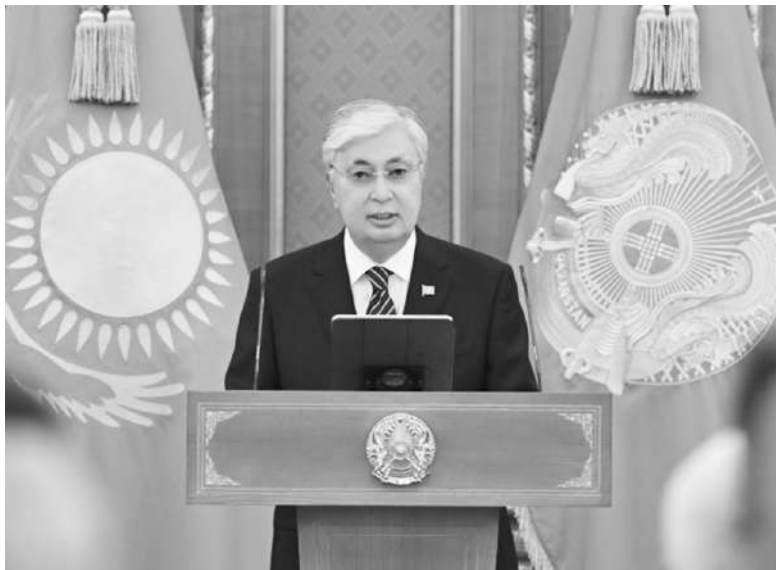
카심-조마르트 토크예프

중앙아시아 카자흐스탄이 첫 원자력발전소 건설 여부를 놓고 올가을 국민투표를 한다고 스푸트니크 통신이 지난달 27일 전했다. 보도에 따르면 카심-조마르트 토크예프 대통령은 이날 국영 언론매체 종사자에 대한 시상식 행사에서 «이 나라는 원자력 개발을 위한 훌륭한 기회들을 갖고 있다. 이들 기회를 효과적으로 이용하는 게 중요하다»며 이같이 밝혔다.