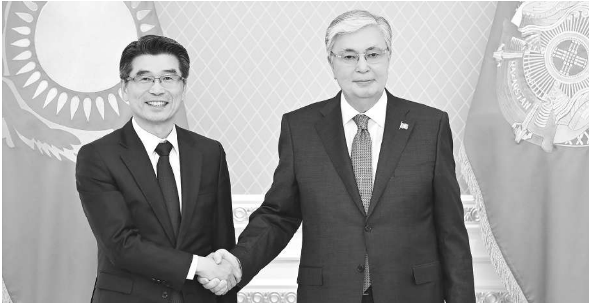
[카심-조마르트 토카예프 카자흐스탄 대통령 (오른쪽)과 송호성 기아 사장 (왼쪽)이 악수하고 있다.]

토카예프 대통령은 '자동차 산업의 발전은 카자흐스탄 산업 정책의 핵심영역 중 하나'라고 강조했다. 송호성은 카자흐 대통령에게 2025년 완공 예정인 코스타나이 시의 풀사이클 자동차 생산 공장 건설 진행 상황을 전했다.