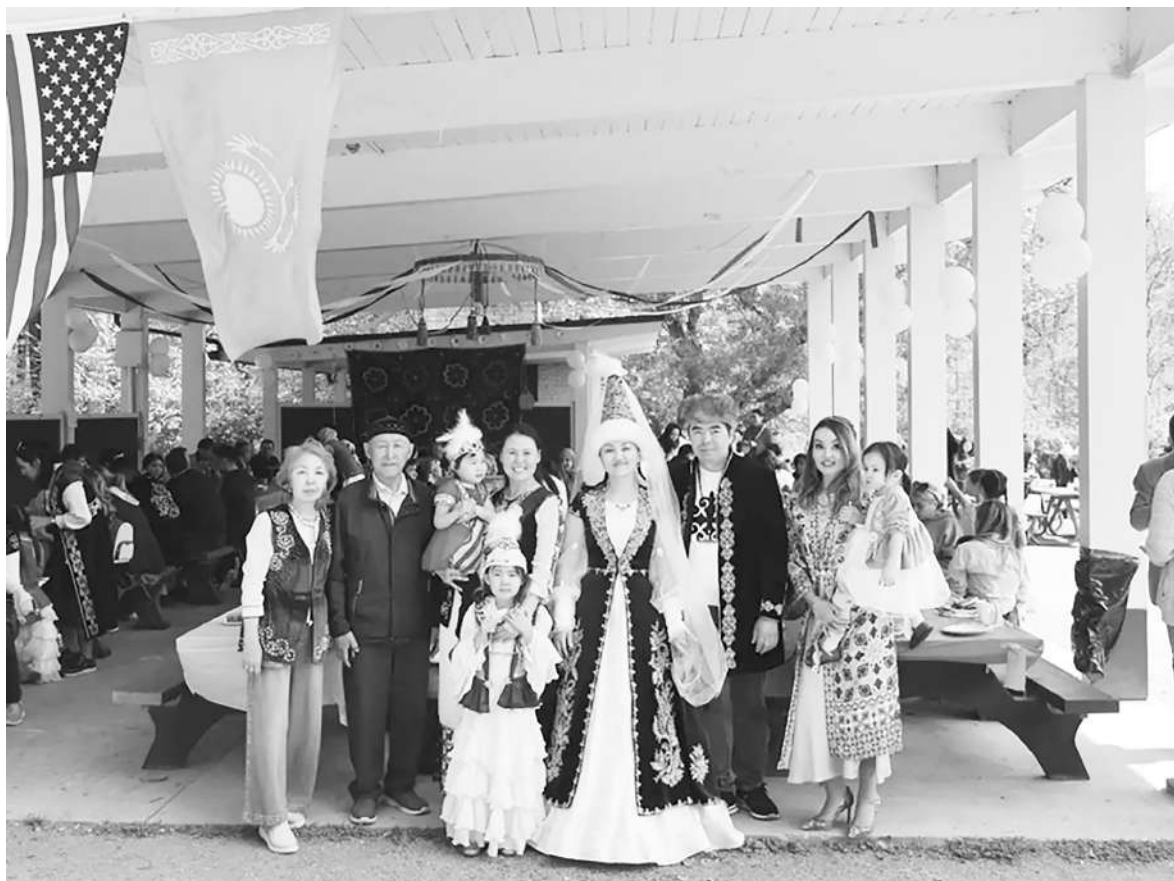
고국 수재민 돕기 캠페인에 나선 미국 워싱턴 D.C. 거주 카자흐스탄 교민들

고려인 협회를 포함한 카자흐스탄 민족회의 산하 여러 민족문화 단체들도 합심해 구호물품과 자원봉사단을 파견하는 등 자선·구호활동에 큰 힘을 쏟고 있다. 카자흐스탄 민족회의는 <오트 세르짜 크 세르쭈(От сердца к сердцу, 이심전심)>라는 타이틀의 캠페인을 발족해 카자흐스탄 전역 산하 단체들로부터 1만 1천 명의 자원 봉사자들을 소집하고 홍수 피해를 입은 아크몰라·카라간다·북카자흐스탄 주들 내 여러 지역들에 파견했으며, 그와 함께 해당 지역들에 옷·가재도 구·식료품·위생용품 등 1천 톤에 달하는 구호물품도 함께 전달한 바 있다.