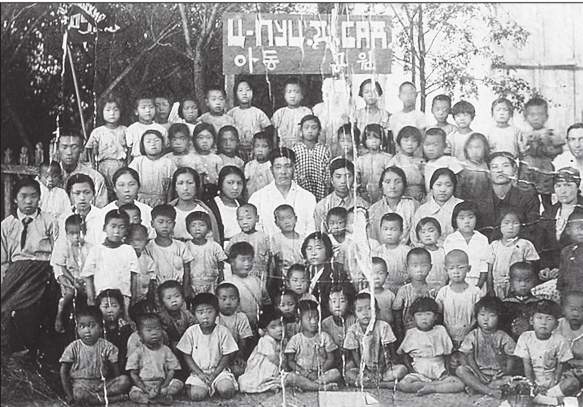
Детский сад села Пуциловка. Конец 1920-х – начало 1930-х гг.