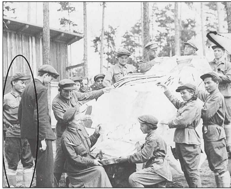
Пак Ир П.А. с районными работниками народного просвещения. Конец 1920-х – начало 1930-х гг.

Многие сельчане приняли православие, чтобы получить русские паспорта и соответственно по 10 десятин земли на «взрослую душу мужского пола». Поэтому в Пуциловке в 1889 году освятили цер-