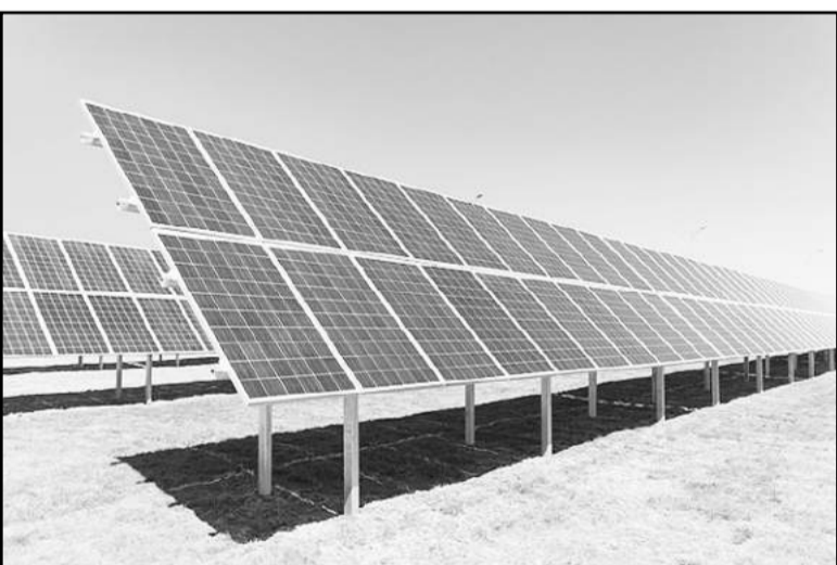
<카자흐스탄이 중앙아시아 최대 규모의 태양광 발전소를 완공하는 등 신재생에너지 개발사업에 박차를 가하고 있다.>

중앙아시아 자원부국 카자흐스탄에서 역대 최대 규모의 태양광 발전소가 처음으로 가동됐다. 이 거대한 태양광 발전소는 카자흐스탄 석탄산업의 심장부인 카라간다주에 들어섰다. 석탄·석유·가스 매장량이 풍부해 녹색에너지 개발을 미뤄오던 카자흐스탄이 신재생에너지 시대를 연 셈이다.