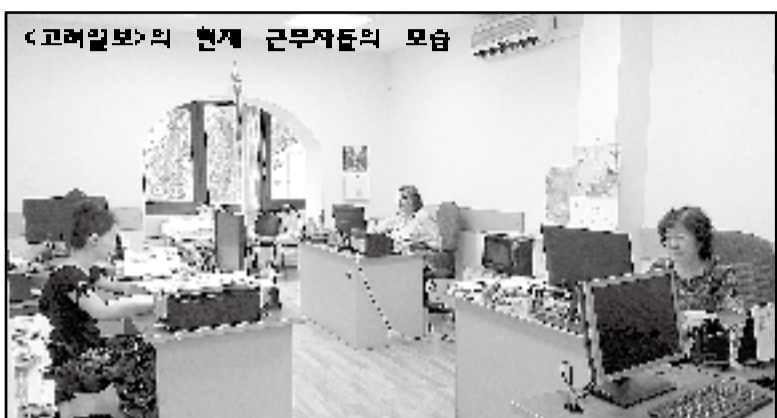
《고려일보》의 현재 근무자들의 모습