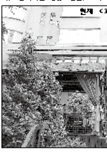
현재 《고려일보》가 자리잡은 한국관 건물

한편 임대비와 유지비 등 재정적인 어려움 등을 겪고 있던 《고려일보》는 한 차례 더 이전을 하게 되었다(2000~2004: 주 수-알마티 아민평의 거리 4: 제1부민청 빌딩). 이 제 번째 이전으로 인해 신문사는 당시 휴업을 단행했고, 2000년 5월 1일자 신보부터 다시 창간을 재개했다(《레닌의지》신보에서 확인 가능). 해당 건물 관리자의 승인에 따르면, 제 번째 건물은 2차세계대전 포로가 된 일간군 포로들에 의해 감매를 이용하여 일괄하게 지어진 건물이라고 한다. 당시에는 8층 건물로 지어