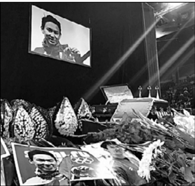
Жизнь – очень хрупкая вещь, никогда не знаешь, что будет завтра. Денис Тен