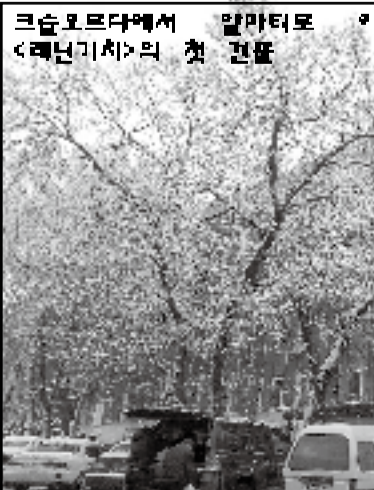
크루노그라드에서 알마티로 이전후 《레닌의지》의 첫 건물

이후 지금은 혼용판이 되었으나 95년의 비사를 이어 온 《고려일보》는 여전히 가자호스인 고려인 사회를 넘어 폭 보훈하고 지켜나가야 할 천민족 전체의 귀한 민족유신이자 최장수인 부분이다. 우리의 사은 관심 하나만으로도 신보는 지켜지고 생명력이 이어질 수 있을 것이다. 이전에도 그랬었던 것처럼 앞으로 70 비사와 정담, 생애이 수 비번 이어져 나갈 수 있도록 관심과 애정이 70 여년 보더라도 더 필요할 것이다.