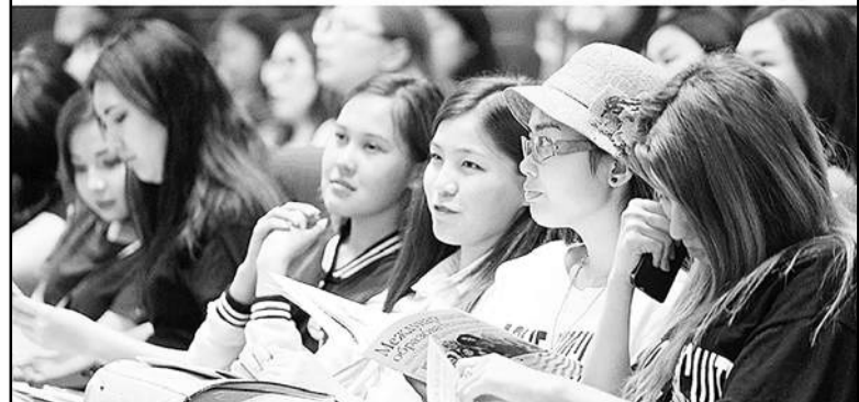
Полосу подготовила Ольга Ли