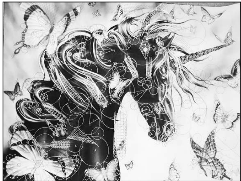
Полосу подготовила Ольга Ли

тирование воспитывает и развивает самостоятельность, заинтересованность, уверенность, ответственность и умение проводить анализ своей деятельности, что является одной из задач обучения.