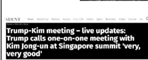
Trump-Kim meeting - live updates: Trump calls one-on-one meeting with Kim Jong-un at Singapore summit 'very, very good'