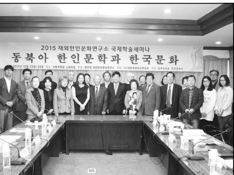
2015 재외한인문화연구소 국제학술회의 동북아 한인문화와 한국문화

현재 한국영상대에는 카자흐스탄, 우즈베키스탄, 키르기스스탄 등 중앙아시아의 14명의 학생들이 정부초청 장학생, 어학연수생 등으로 재학 중이다.