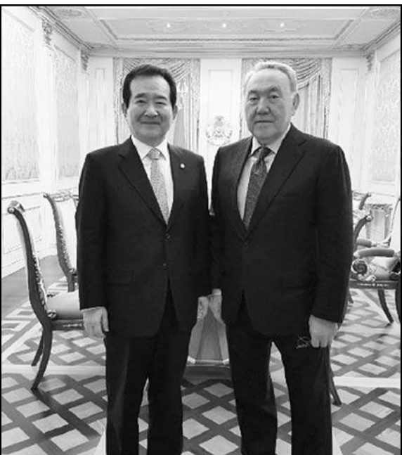
준데 대해 감사의 뜻을 밝혔다. 또한 정세균 의장은 나자르바예프 대통령에게 니그마를린 하원의장과 면담 결과와 양국 의회간 협력 협정 체결을 설명하였다.

나자르바예프 대통령은 정세균 국회의장과 면담에서 한국-카자흐스탄 경제무역관계 발전에 대해 언급하고, 양국간 경제협력에 더 심화되기를 바란다 “한국과 카자흐스탄은 매우 우호적인 관계에 있습니다. 양국간 교역액은 20억달러에 가까우며 한국의 상품들이 카자흐스탄이 물류터미널을 보유하고 있는 중국 연운항을 통해서 들어오고 있다는 것이 긍정적입니다. 카자흐스탄은 한국과 IT 및 신기술, 산업화, 보건 등 분야에서 협력 관계를 유지할 계획입니다”라고 나자르바예프 대통령이 언급하였다. 아울러 나자르바예프 대통령은 카자흐스탄과 한국의 의회 간 협력 강화 필요성을 강조하였다. 정세균 국회의장은 나자르바예프 대통령 면담을 통해 양국간 현안을 논의하게 된 데 대해 사의를 표하였다. 정세균 의장은 아스타나의 놀라운 발전 속도에 대해 언급하고, 지난해 아스타나 엑스포와 28회 동계유니버시아드 대회와 같은 국제적 행사 개최를 높이 평가하였다. 정세균 의장은 양국관계의 전략적 성격을 강조하면서, ‘카자흐스탄 2050 전략’의 목표 달성에 한국이 파트너로 참여할 준비가 되어 있다고 밝혔다. 이와 함께 정세균 의장은 카자흐 민족이 1930년대 강제이주된 고려인들을 돕고 지원해