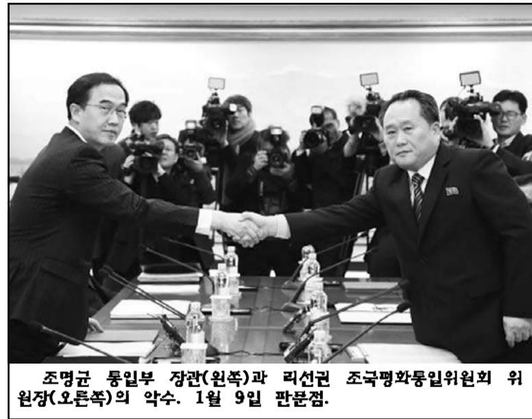
조명균 통일부 장관(왼쪽)과 리선권 조국평화통일위원회 위원장(오른쪽)의 악수. 1월 9일 판문점.

이다. 북한은 현재 핵실험으로 인한 국제사회의 제재를 받고 있는 상황이다. 따라서 성공적인 올림픽 개최를 위한 양국의 협력에 여러 가지 고려할 사항들이 많이 놓여 있긴 하다.