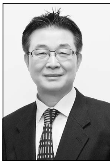
주알마티총영사 전승민 올림