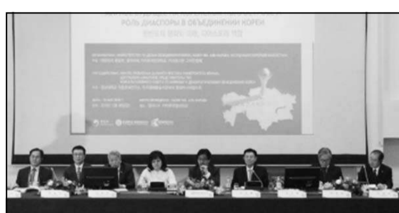
카자흐 국립대에서 개최된 '2018 한반도 국제학술포럼' (2018.5.18)

북미 정상회담 전에 핵탄두 일부를 미국에 전달할 것도 요구되고 있는데 아직 공식 입장은 표명되지 않고 있다. 사실 이 부분이 가장 민감한 내용이며 북미 정상회담의 제일 중요한 사안이 될 수도 있다. 미국은 북한이 어떤 형태