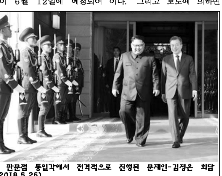
판문점 통일각에서 전격적으로 진행된 문재인-김정은 회담 (2018.5.26)

카자흐 국립대에서 개최되었던 '2018 한반도 국제학술포럼' 및 '한민족 축제'는 잘 알려지지 않은 어려웠던 준비과정에도 불구하고 분명히 한반도 평화체제를 염원하는 사람들이 만든 것이었다. 그 결과 남북한 학자와 공연단이 한 자리에 모인 것이었다. 이러한 모임은 정치적인 풍향에 관계없이 지속적으로 행해지기를 바라는 것이 필자의 희망이다. "일단 서로 자주 만나고 보자"라는 말을 꼭 기억하자.