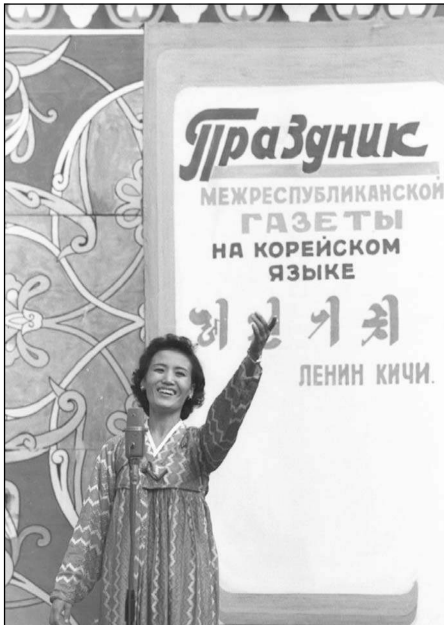
Праздник газеты «Ленин кичи» в Ташкенте в эпоху «Перестройки, гласности и демократизации»