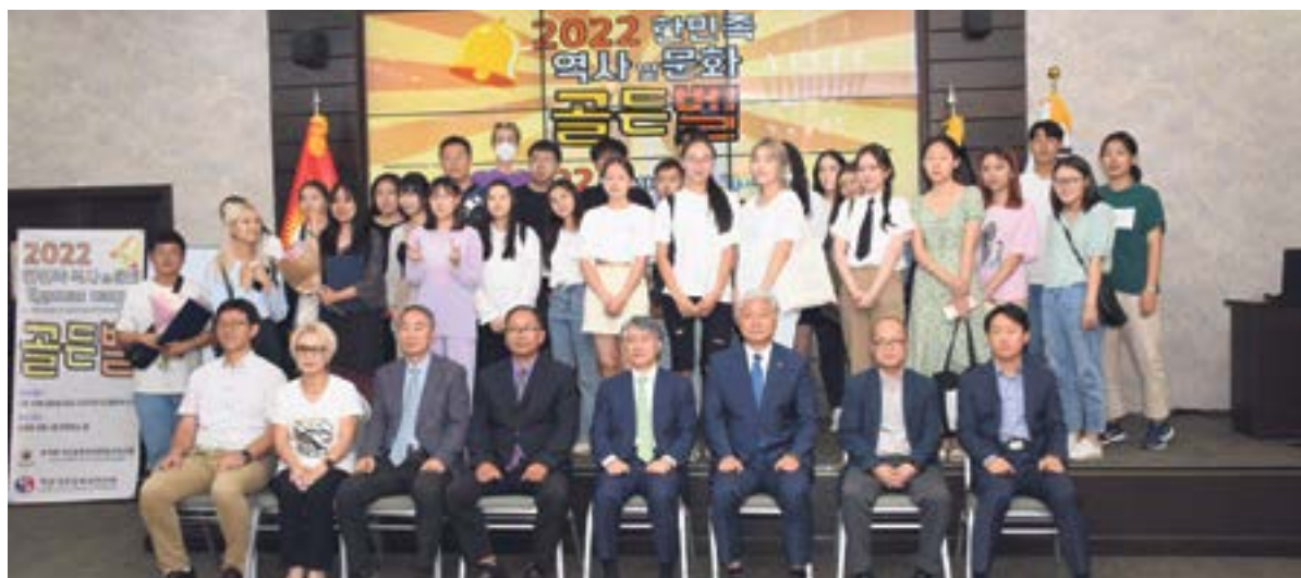
ВИКТОРИНА «ЕДИНАЯ НАЦИЯ – 2022» стр. 6