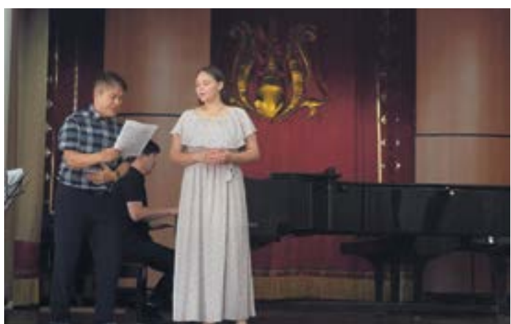
МАСТЕР-КЛАСС ПО ВОКАЛУ ОТ ТЕНОРА ЛИ ЫН МИН стр. 7