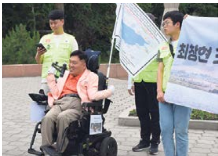
МЫ МОЖЕМ ЭТО ПРЕОДОЛЕТЬ! стр. 2