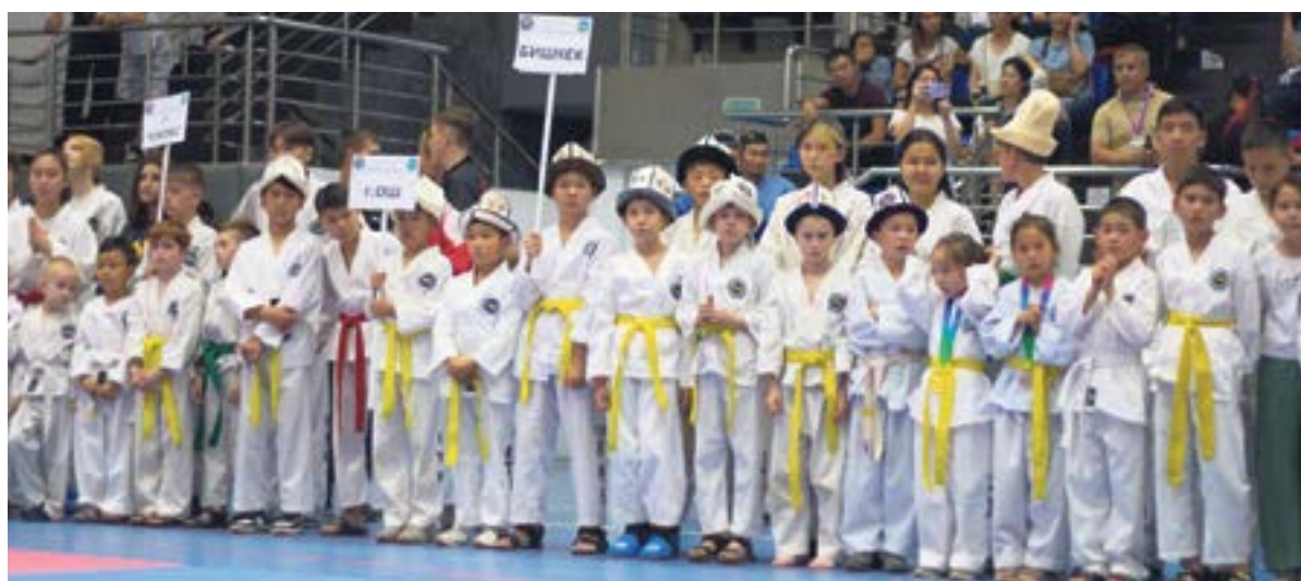
ЧЕМПИОНАТ И ПЕРВЕНСТВО КР ПО ТХЭКВОНДО ITF стр. 7