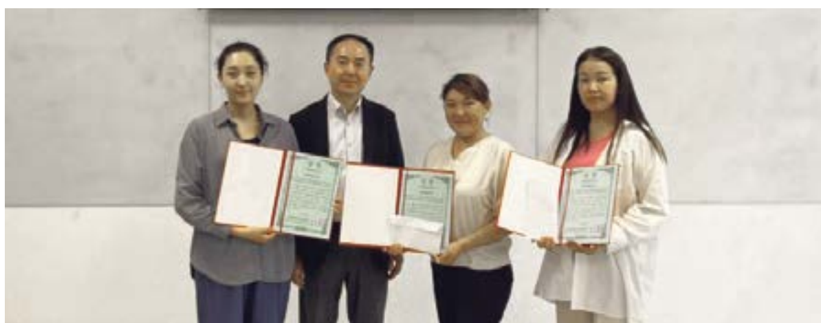
НАГРАЖДЕНИЕ ПОБЕДИТЕЛЕЙ стр. 7