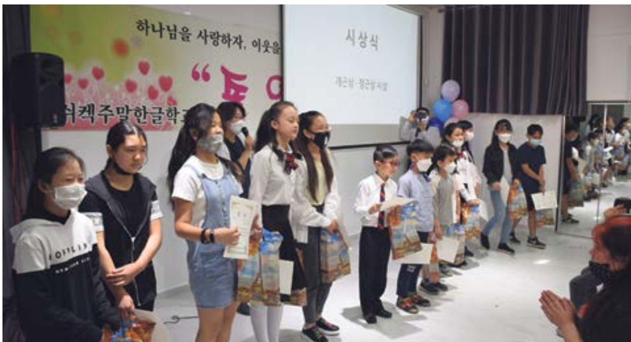
ОКОНЧАНИЕ ВЕСЕННЕГО СЕМЕСТРА