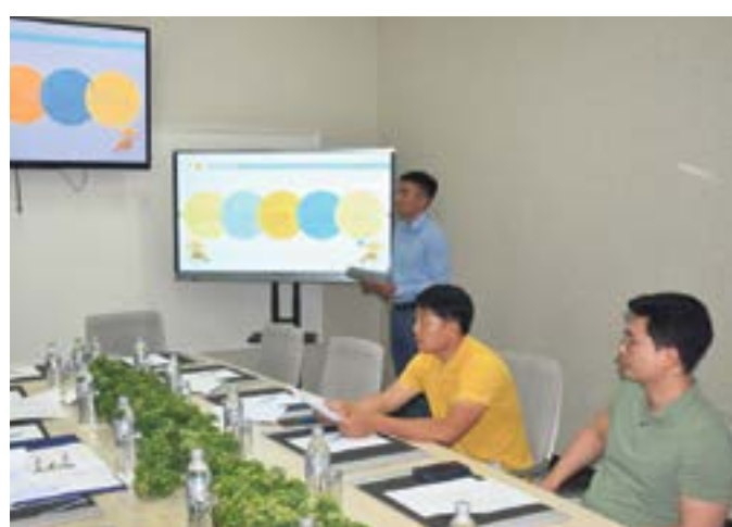
ПРЕЗЕНТАЦИЯ МЕЖДУНАРОДНОГО БИЗНЕС-ЛАГЕРЯ НА ИССЫК-КУЛЕ