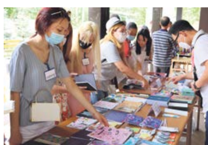
ЛЕТНЯЯ ЯРМАРКА ОТ «ДРИМ АКАДЕМИИ»