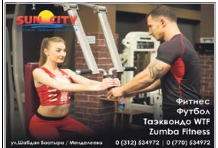
ул.Шабдан Баатыра / Менделеева 0 (312) 534972 | 0 (770) 534972

- После Учредительной конференции сразу начали с мужем подготовку к организации регионального отделения в Аламудунском районе Чуйской области.