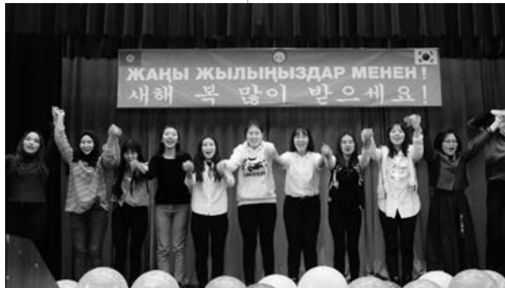
방문기자 크세니아 토르카너바

은 자신들의 무대를 선보이기도 했다. 이날 가장 중요한 행사는 세배였다. 한국 전통에는 명절에 손자들이 할머니 할아버지에게 새해 인사를 하며 만약 할머니 할아버지가 안 계실 경우 부모님이나 친인척에게 세배를 한다. 이에 학생들은 행사에 참석한 주요 손님들을 무대로 초청했으며 하태역 대사가 훌륭한 행사 준비에 감사를 표하며 선물을 전달하기도 했다.