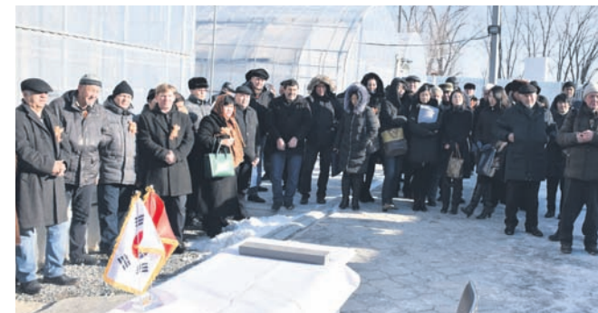
11.12.2017 г. Церемония завершения строительства теплиц Корейско-Кыргызского агропромышленного центра (открытие четвертой очереди)