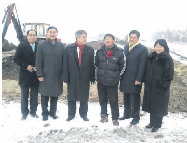
07.12.2011 г. Визит в Кыргызстан вице-президента Фонда зарубежных корейцев

- В первую очередь, это повышение конкурентоспособности коре сарам за счет новых технологий, которые развиваются в Коре. Во-вторых – позиционирование корейцев в Кыргызстане как этноса, который вносит свой вклад в развитие сельского хозяйства. И в третьих – формирование материально-технической базы ООК КР. Для страны мы рассматривали этот комплекс как учебный центр для местных фермеров. Также данные теплицы – это решение проблем продовольственной безопасности страны, ведь очень много овощей завозилось из Китая и Узбекистана. После развала СССР тепличное хозяйство в Кыргызстане пришло в упадок, и все необходимо было начинать с нуля.