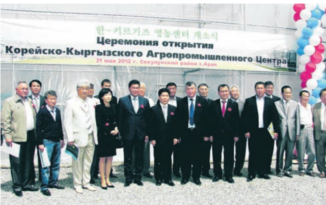
21.05.2012 г. Открытие Корейско-Кыргызского агропромышленного центра

- На сегодняшний день общая площадь теплиц составляет 1 гектар – 7 хаусов, которые были сданы четырьмя очередями. По урожайности - от 70 до 100 т/га томатов. Выращивание производится на гидропонике, по корейским технологиям.