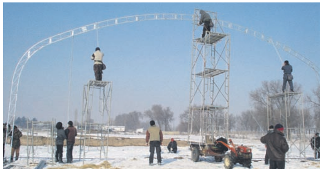
20.01.2012 г. Первая арка

- Дело в том, что контейнера с теплицами пришли позже положенного срока, когда наступили холода. Груз проделал долгий путь из Кореи в Китай морским транспортом, затем через Казахстан в Кыргызстан. В декабре грунт уже замерз, поэтому возникли сложности со строительством.