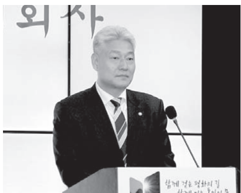
참석하신 손님들에게 정병후 키르기스 한국 대사가 환영 인사를 했습니다.