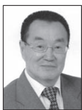
25 декабря Ким Феликс Терентьевич (Член Президиума ООК КР)