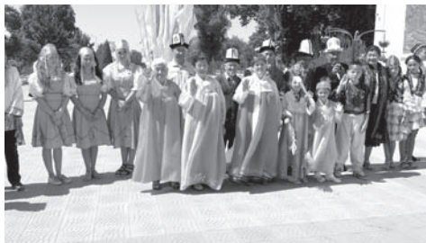
Толерантность-важная черта жителей Узбекистана

Как известно, долготерпеливый лучше храброго, а владеющий собою лучше завоевателя. Об этом написано еще в Притчах Соломоновых, глава 16, стих 32. И не случайно ЮНЕСКО в связи с 50-летием создания этой авторитетной организации в ноябре 1995 года учредила Международный день толерантности (терпимости), который отмечается ежегодно 16 ноября. Именно 16 ноября 1995 года государства-члены ЮНЕСКО приняли Декларацию принципов толерантности.