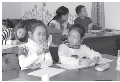
Конкурс детского рисунка

уже много лет при Н О К К Ц успешно действуют курсы корейского языка - две группы с разным языковым уровнем. Дети занимают с удовольствием. Учебные кабинеты хорошо