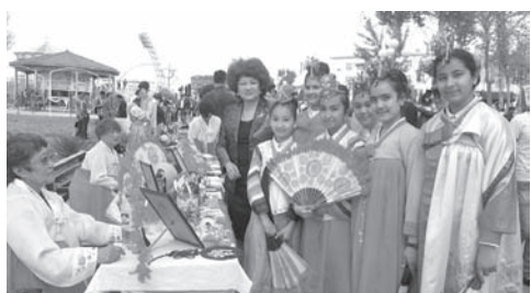
На фестивале «Узбекистан - наш общий дом»

Только в первом полугодии на счету центра их было уже более десятка. Каждое проводится интересно, с выдумкой и