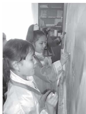
На курсах корейского языка

оснащены, имеется вся необходимая мебель. Есть 10 компьютеров, 2 плазменных ТВ, проектор с экраном, музыкальный центр и многое другое. Во всех кабинетах установлены современные кондиционеры. Такие великолепные условия для занятий, которые проводят опытные преподаватели - не в каждом даже республиканском национальном культурном центре встретишь. В конце учебного года учащиеся по традиции