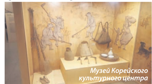
Музей Корейского культурного центра

В нем есть корейский исторический музей, очень красиво оформленный. Неповторимая атмосфера, музыка, приглушенный свет создают эффект присутствия, как будто срабатывает своеобразная машина времени.