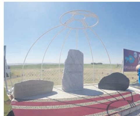
Мемориальный комплекс, посвященный корейским переселенцам.

В этом небольшом городке для нас организовали, пожалуй, самую незабываемую встречу. Экскурсию проводил лично мэр г. Уштобе, Бисембаев Кайрат Аширалыулы. Он показал нам действующую корейскую школу в с. Жанаталап (бывшее село Дальний Восток). До 2008 г. директорами там были корейцы. Мы посетили мемориальный комплекс, посвященный корейским переселенцам. На его территории сохранились остатки тех самых, первых землянок. На территории комплекса мы заложили капсулу с посланием потомкам.