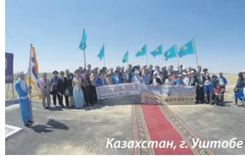
Казахстан, г. Уштобе

украшен андреевскими флагами и флагами ВМФ СССР. Даже уроженцы Южной Кореи испытали на фоне этого великолепия какой-то патриотический подъем, а что уж говорить обо мне, родившимся в СССР! В тот же день мы посетили памятник Александру III, основателю сибирской железной дороги, и различные городские исторические музеи.