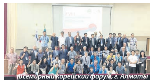
Всемирный корейский форум, г. Алматы