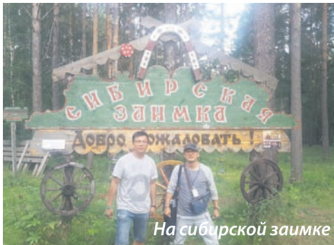
На сибирской заимке

В Иркутске нас также встречали представители местной корейской диаспоры и гиды. Нам устроили экскурсию по городу и окрестностям, показав достопримечательности. Мы пробыли там сутки, после чего поехали на Байкал. На станции Байкал мы посетили горнолыжную базу, в летнее время называемую