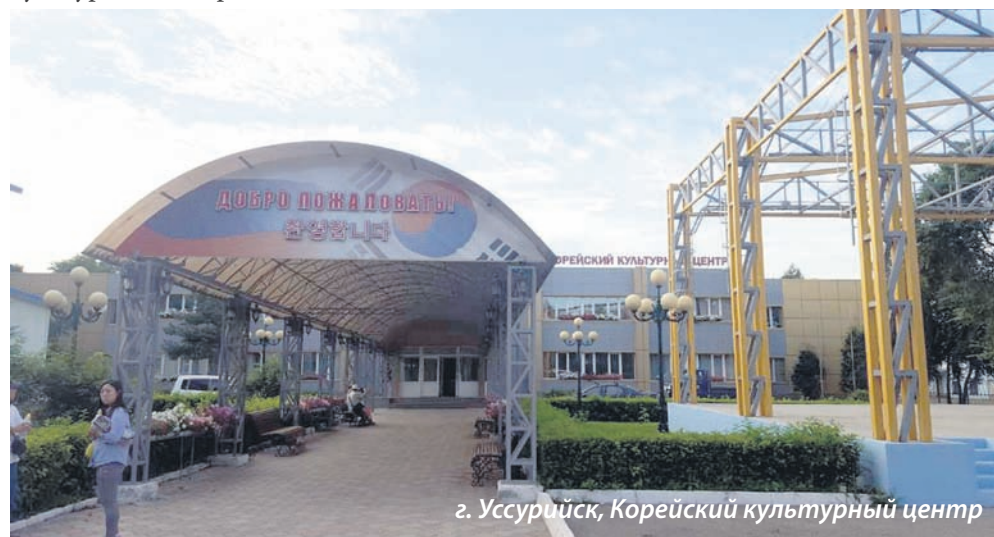
г. Уссурийск, Корейский культурный центр

Затем было посещение Корейского культурного центра.