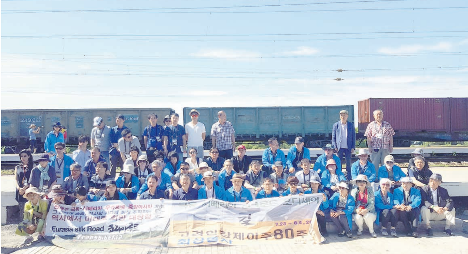
г. Владивосток, бухта «Золотой Рог»

Станция «Раздольное» – отсюда осуществлялась отправка корейского населения в Среднюю Азию.