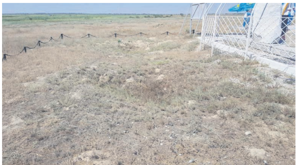
За мемориальным комплексом расположены те самые землянки, точнее то, что от них осталось.