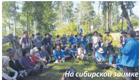
На сибирской заимке

местными жителями «видовая». Налюбовавшись красивейшим озером России и покатавшись на катере, была проведена небольшая лекция, где профессора корейских университетов рассказывали об истории корейцев в целом, читали стихи, пели песни. После этого мы заехали на заимку – одну из таежных достопримечательностей, где гости из Кореи впервые отведали настоящего сибирского борща и шашлыка.