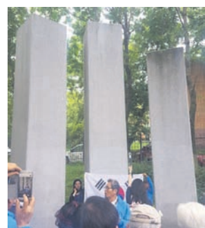
Мемориальный комплекс корейцев России

В этот же день у нас состоялась свободная экскурсия по Владивостоку, мы гуляли по городу, пробовали морепродукты, знакомились с суровым, но красивым городом. Вечером наша группа на поезде выехала в Иркутск.