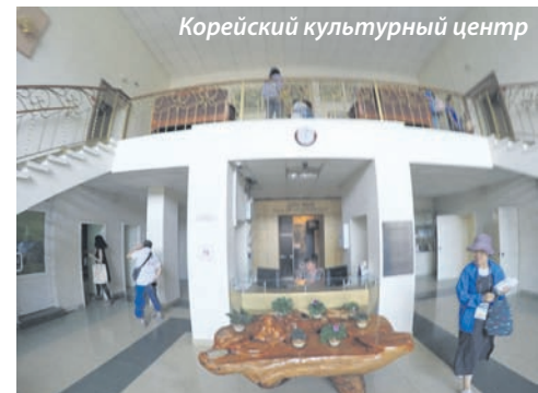
Корейский культурный центр

В нем есть корейский исторический музей, очень красиво оформленный. Неповторимая атмосфера, музыка, приглушенный свет создают эффект присутствия, как будто срабатывает своеобразная машина времени.