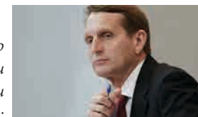
Директор Службы внешней разведки Российской Федерации С.Е.Нарышкин:

следствие. Если оно будет возможно более оперативным, если на него будут брошены абсолютно лучшие умы и силы, если займёт исчерпывающую и недвусмысленную позицию высшее руководство Турции - мы Турции поверим. Но только в этом случае. Нужна максимальная демонстрация политической воли турецкого государства и нужны последующие решения, связанные с выявившейся неспособностью обеспечить безопасность и защитить жизнь посла. Ближайшие дни и даже часы многое в этом смысле покажут. И в зависимости от этого надо будет определяться с дальнейшими мерами по защите безопасности российских граждан, находящихся в Турции.