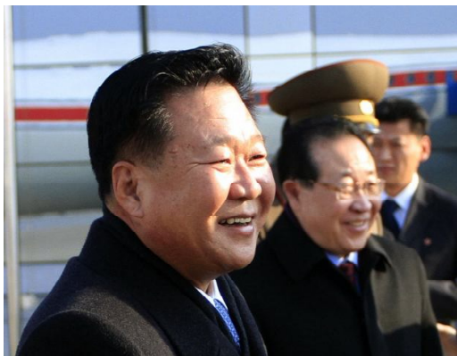
Спецпосланник руководителя КНДР Цой Рён Хэ (слева)

В повестке дня были двусторонние отношения и международная проблематика с акцентом на ядерную проблему