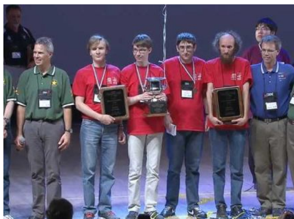
Команда Санкт-Петербургского государственного университета (в центре)

Впервые за пределами США финал ACM-ICPC состоялся в 1999 г. в Нидерландах, а затем в