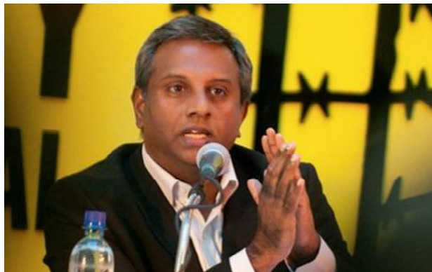
Салиль Шетти, генсек этой организации

Amnesty International направила официальное письмо президенту Пак Кын Хе в связи с нарушениями прав человека в Южной Корее. Решение отправить письмо точно к первой годовщине вступления Пак на президентский пост было воспринято многими как “необычный шаг”.