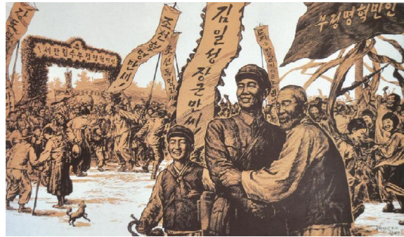
“Рождение Народной власти” Автор Хан Сон Гю. 980 x 1700 мм. 97 год Чучхе (2008)

Это стало особым событием в истории корейской нации. Именно 15 августа 1945 года корейский народ встретил новый день – день возрождения нации и с той поры открылась новая страница истории Народной Кореи - социалистической Кореи.