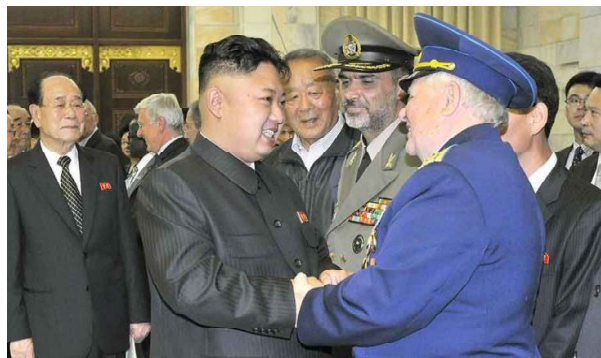
Маршал Ким Чен Ын и Ян Канов

29 июля нам предложили отдых в горах Мехян, что в двух часах езды от Пхеньяна. Нас разместили