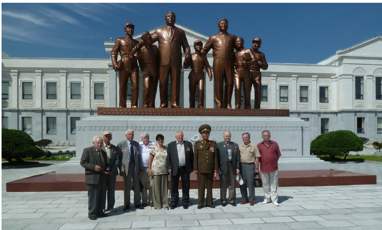
В Военном училище им. Ким Ир Сена