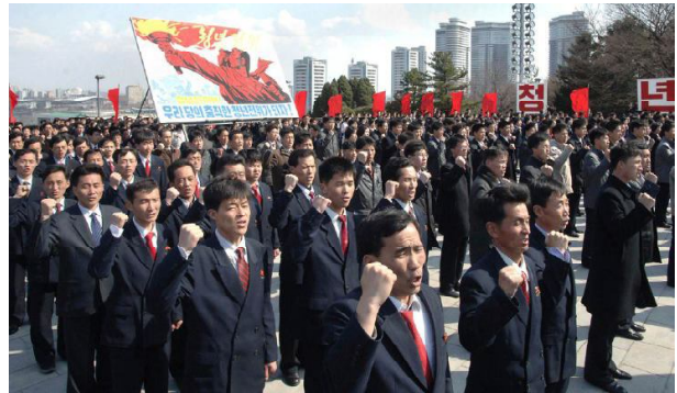
Демонстрация в Пхеньяне 10 апреля, 2013.

Недавно, в конце марта, я вернулся из поездки в КНДР, вместе с 45 коллегами, организованной Когуо Tours. Во время этой поездки я имел возможность обсудить с корейскими гидами их взгляды на текущую ситуацию. Я вспоминаю предложение КНДР, про которое как-то говорили корпоративные СМИ, когда Деннис Родман [1] вернулся с посланием от нового Высшего Руководителя Ким Чен Ына: «Я не хочу войны, позвоните мне». Президент Обама, лауреат Нобелевской премии мира, отказался принять это послание, очевидно, предпочитая обсуждать возрастающую угрозу ядерной войны в регионе. Я попросил моих корейских гидов дать интервью, чтобы я мог донести их точку зрения до американских читателей.