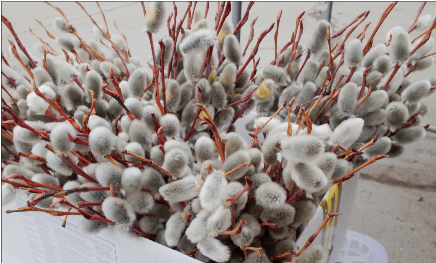
▲ 4월 28일은 종려주일(사순절)이다.